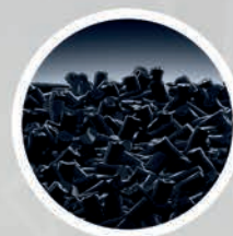
4. Filtr węglowy

dezaktywuje najbardziej niepożądane zanieczyszczenia stałe jak: pyły zawieszane PM2.5, PM10, PM1, które są głównymi składnikami smogu; pyłki roślin, zarodniki pleśni, roztocza.