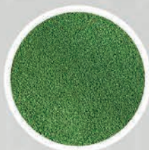
2. Powłoka antybakteryjna

to pierwsza bariera dla zanieczyszczeń, która zatrzymuje większe cząsteczki takie jak sierść zwierząt, kurz, włosy i większe pyły.