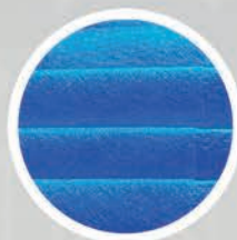
3. Filtr HEPA

Zwalcza w 99,99% bakterie E.Coli, gronkowca złocistego oraz drożdżaków, a także zapobiega rozwojowi pleśni.