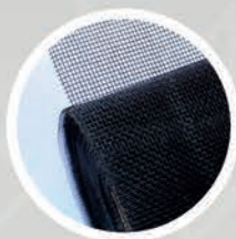
1. Filtr wstępny

Oczyszczacze powietrza marki Vestfrost, oprócz systemu filtrów, wykorzystują dwie dodatkowe metody neutralizacji zanieczyszczeń . We wszystkich modelach urządzeń tej marki zastosowano filtry 4w1, które pochłaniają 99,95% szkodliwych cząsteczek o rozmiarze wielkości do 0,3 mikrona . Dopełnieniem procesu oczyszczania są innowacyjne technologie UV-C LED oraz Plasma ION .